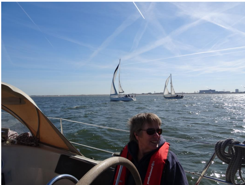
Rondje Noord-Holland 2016